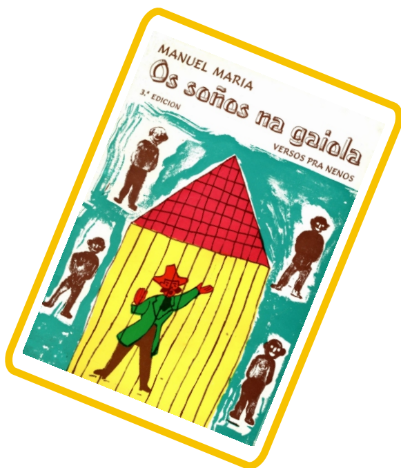
Biblioteca e ENDL CEIP "Juan Fdez Latorre"

Segundo confesa o autor, este conxunto de corenta e nove poemas, nados da súa infancia labrega, son unha recuperación dos versos que botou de menos na nenez, cando non existían obras de literatura infantil.